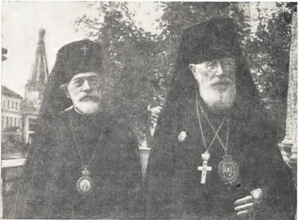
АДАМ, АРХИЕПИСКОП ФИЛАДЕЛЬФИЙСКИЙ И КАРПАТОРОССКИЙ, И АНТОНИЙ, ЕПИСКОП б. САН-ФРАНЦИССКИЙ И КАЛИФОРНИЙСКИЙ

лась» — стала христианскою, так как Христа, де, на Руси больше нет. Интересно и то, что небесной покровительницей этого процесса «христианизации» России римский папа провозгласил католическую святую, француженку, кармелитку-монахиню Терезию, не связанную с Россией никакими воспоминаниями.